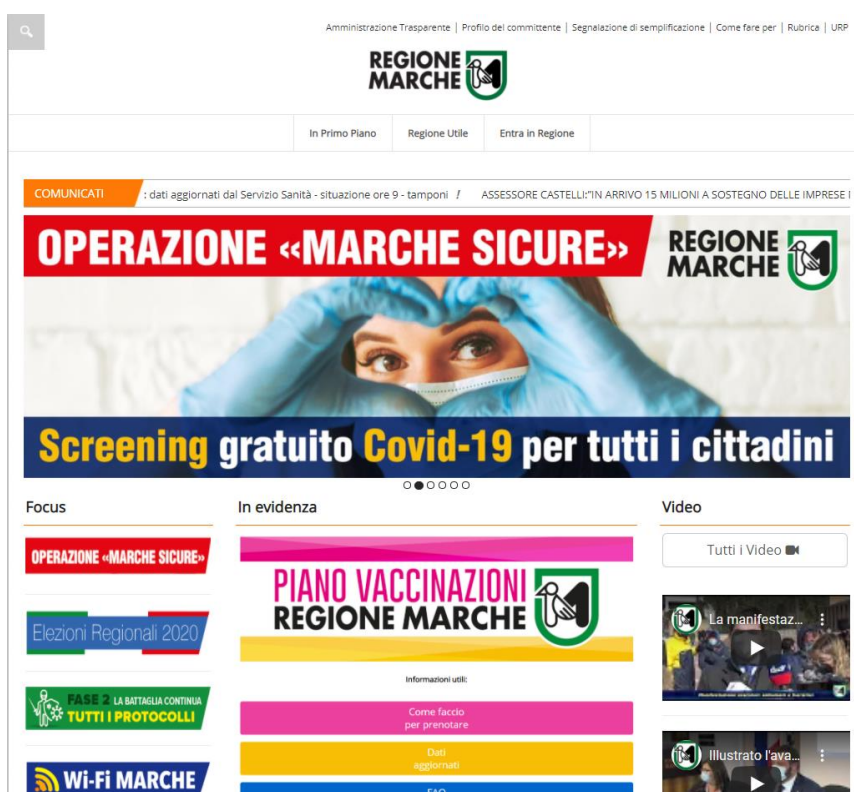
Figura 1 l'home page del sito istituzionale di Giunta

La stessa idea di accessibilità viene intesa non solo quale requisito tecnologico o psicologico riferito all'usabilità degli strumenti, ma soprattutto quale principio generale di garanzia all'accesso diffuso e indifferenziato, da parte di tutti, ai contenuti di una comunicazione e di un'informazione istituzionale utile.