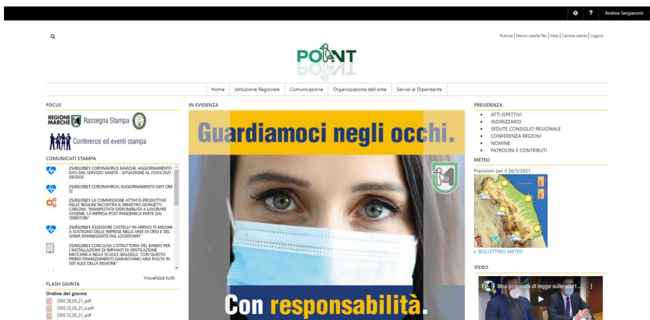
Figura 2 l'home page della Intranet di Giunta

La intranet Point, in tecnologia Microsoft Sharepoint 2016, è strutturata nelle sezioni: Home page, Istituzione, Comunicazione, Organizzazione, Servizi al dipendente. In essa vengono pubblicati annunci/avvisi per il personale, circolari, modulistica e vari contenuti documentali o html. Per far fronte alle esigenze di riorganizzazione del lavoro agile (o smart working) dei dipendenti, i sistemi di front-end regionali sono stati affiancati da ulteriori strumenti digitali di collaborazione a distanza, quali la project community per la condivisione di file basata sul sistema open source Alfresco Share, il sistema questionari.regione.marche.it per la proposta di consultazioni pubbliche o private agli utenti, basato su Lime Survey, le piattaforma per le videoconferenze Lifesizecloud e Microsoft Teams e numerosi altri sistemi informativi gestionali e documentali a disposizione dell’utenza interna ed esterna (CohesionWork, MeetPAd, Paleo, OpenAct, etc.).